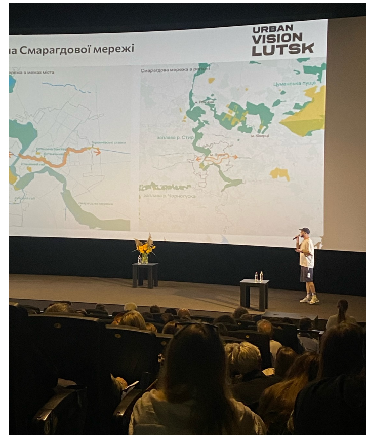
УкрУрбанФорум (м. Чернівці)