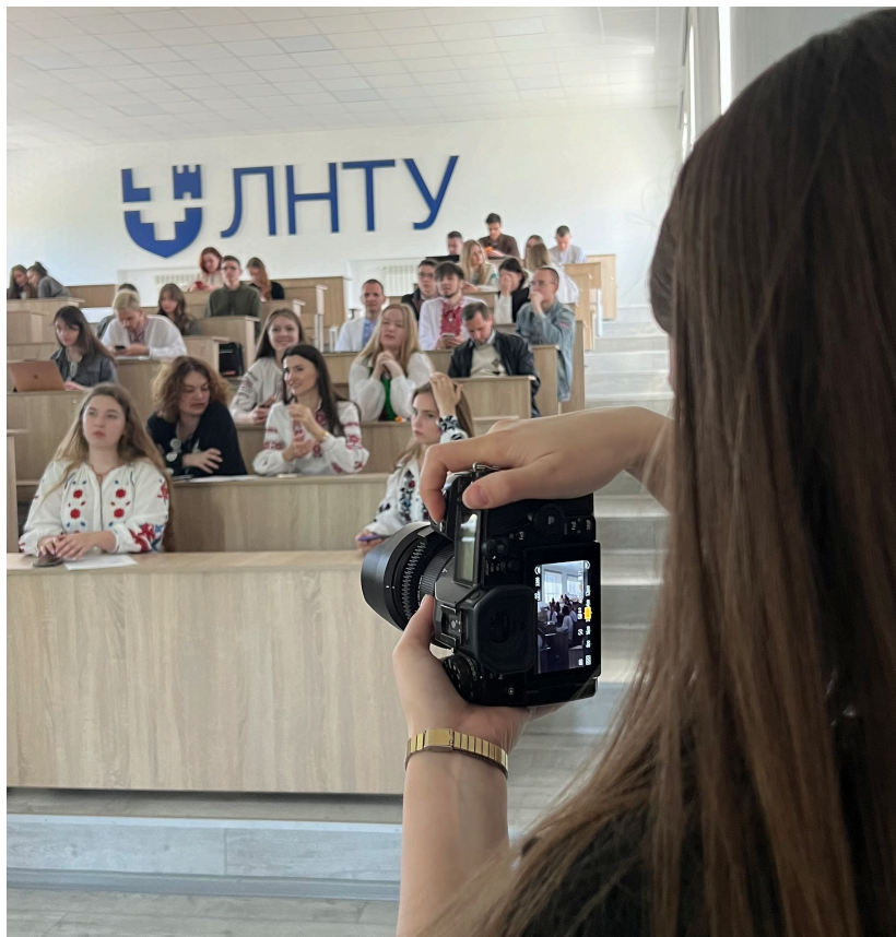
Молодіжний Науковий Форум 1.0 від ЛНТУ (м. Луцьк)